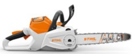
MOTORSÄGE MSA 200 C-B 36 V • 1,8 kW ① • 3,1 ② / 3,5 kg ③ APIII SYSTEM

* Aktion gültig mit dem Akku AP 200 S und AP 300 S. Andere Akkus sind von der Aktion ausgeschlossen.