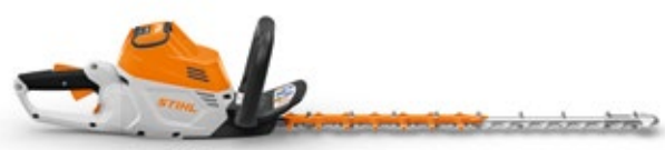
HECKENSCHERE HSA 100 36 V • 3,7 kg ③ APIII SYSTEM