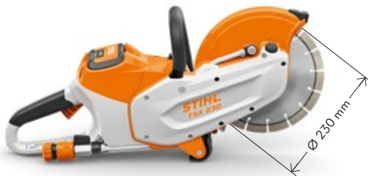
TRENSCHLEIFER TSA 230 ⑤ 36 V • 3,9 kg ③ APIII SYSTEM