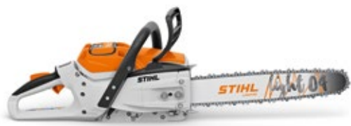
MOTORSÄGE MSA 300 C-O 36 V • 3,0 kW ① • 4,5 ② / 5,4 kg ③ APIII SYSTEM

MSA 200 C-B ohne Akku und Ladegerät ④ Schiennlänge 30 cm Bestellnummer MA03 200 0009 CHF 510.-